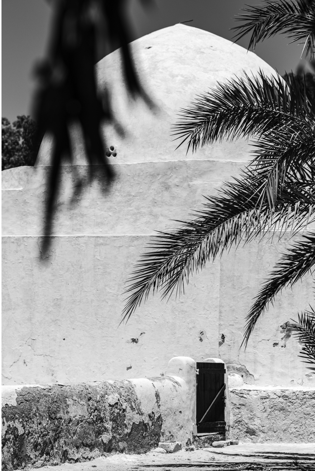
Houmt Souk 06/2025