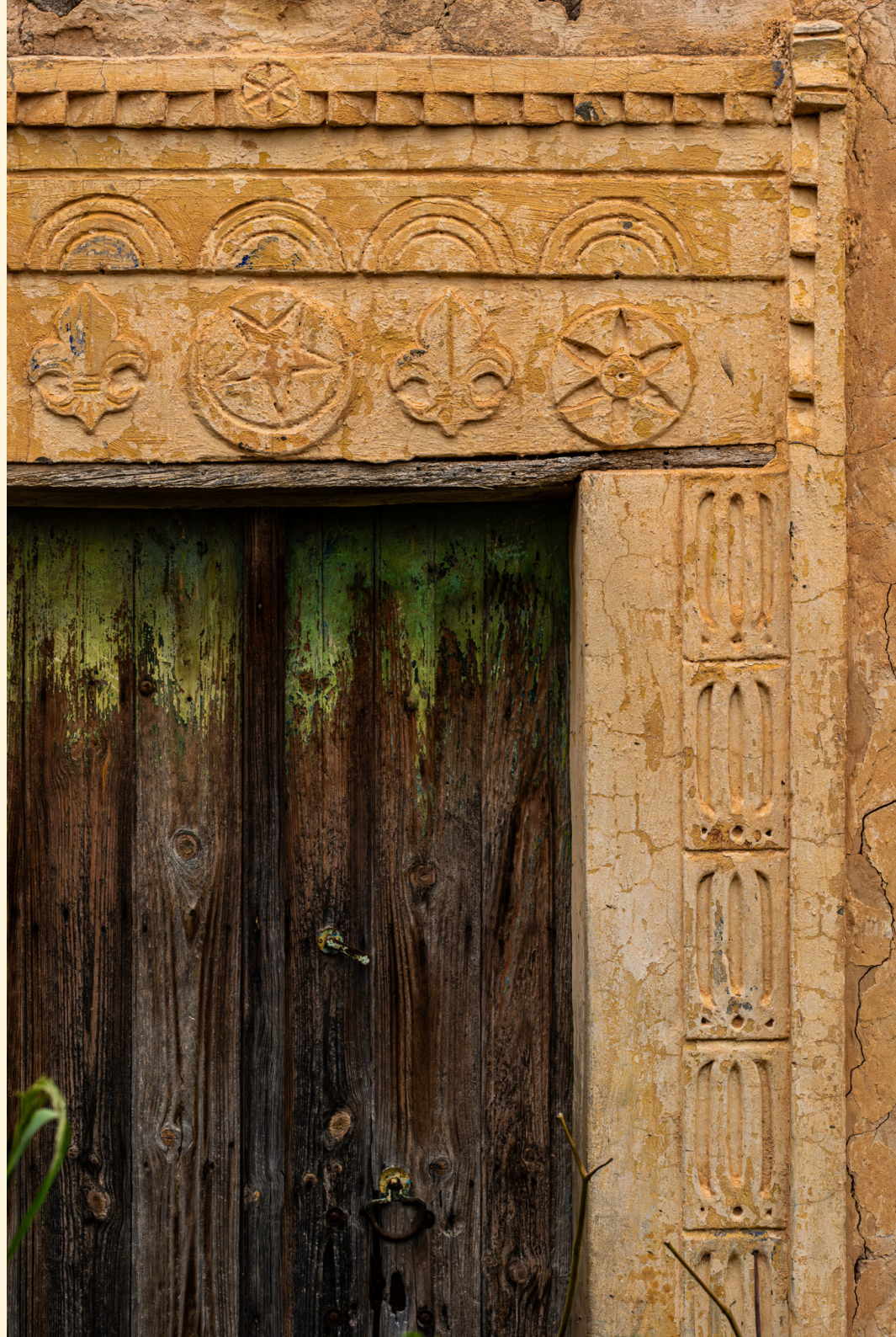
Porte 03/25 Ramlan 03/25