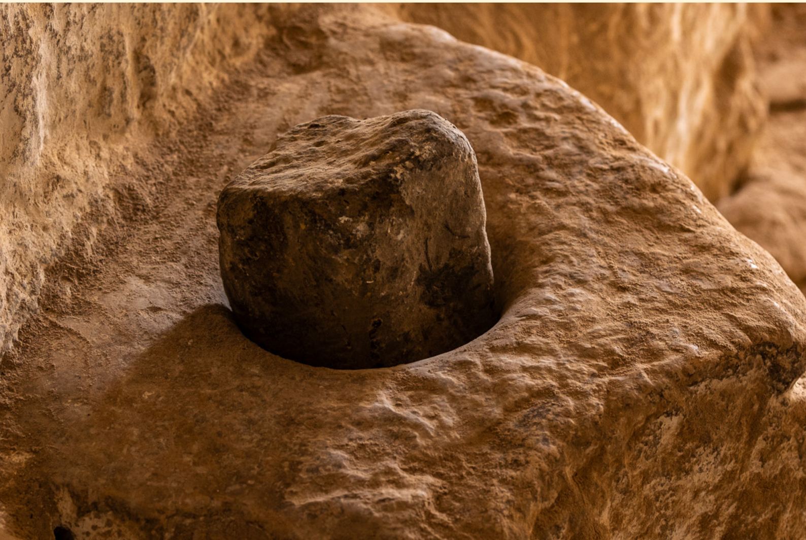
Pilon dans une maison troglodyte Douiret 11/2023