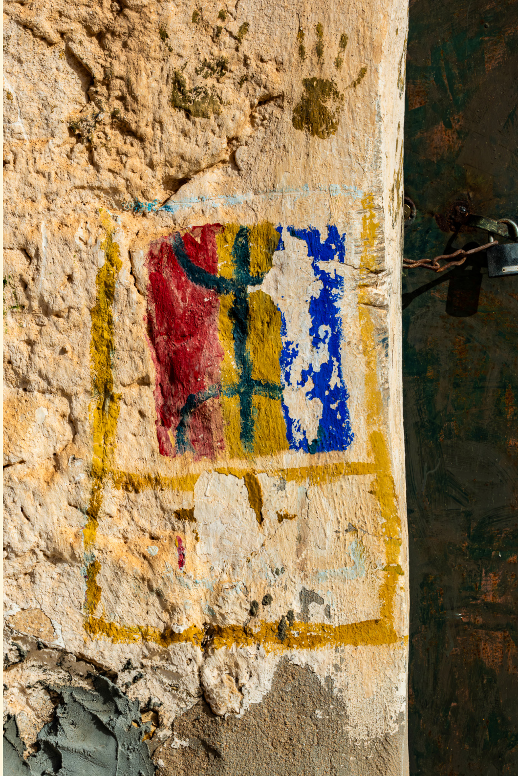
YAZ Symbole amazigh "homme libre"