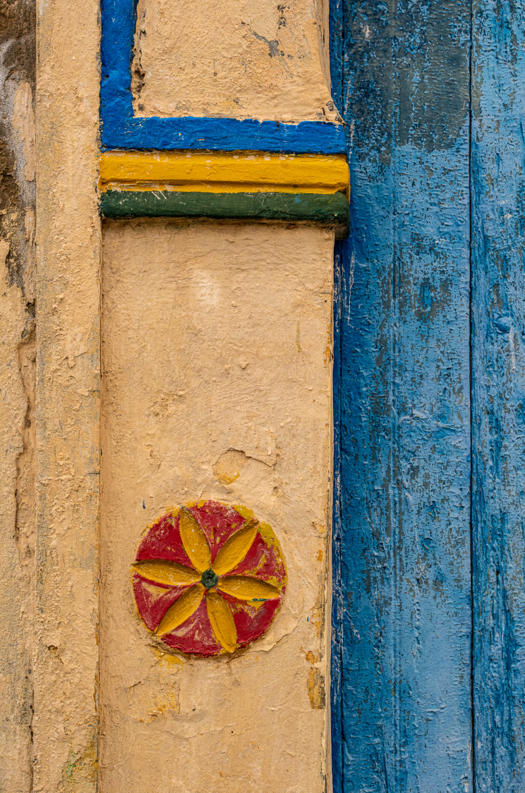
Symbole de roue solaire Ramla 03/2025