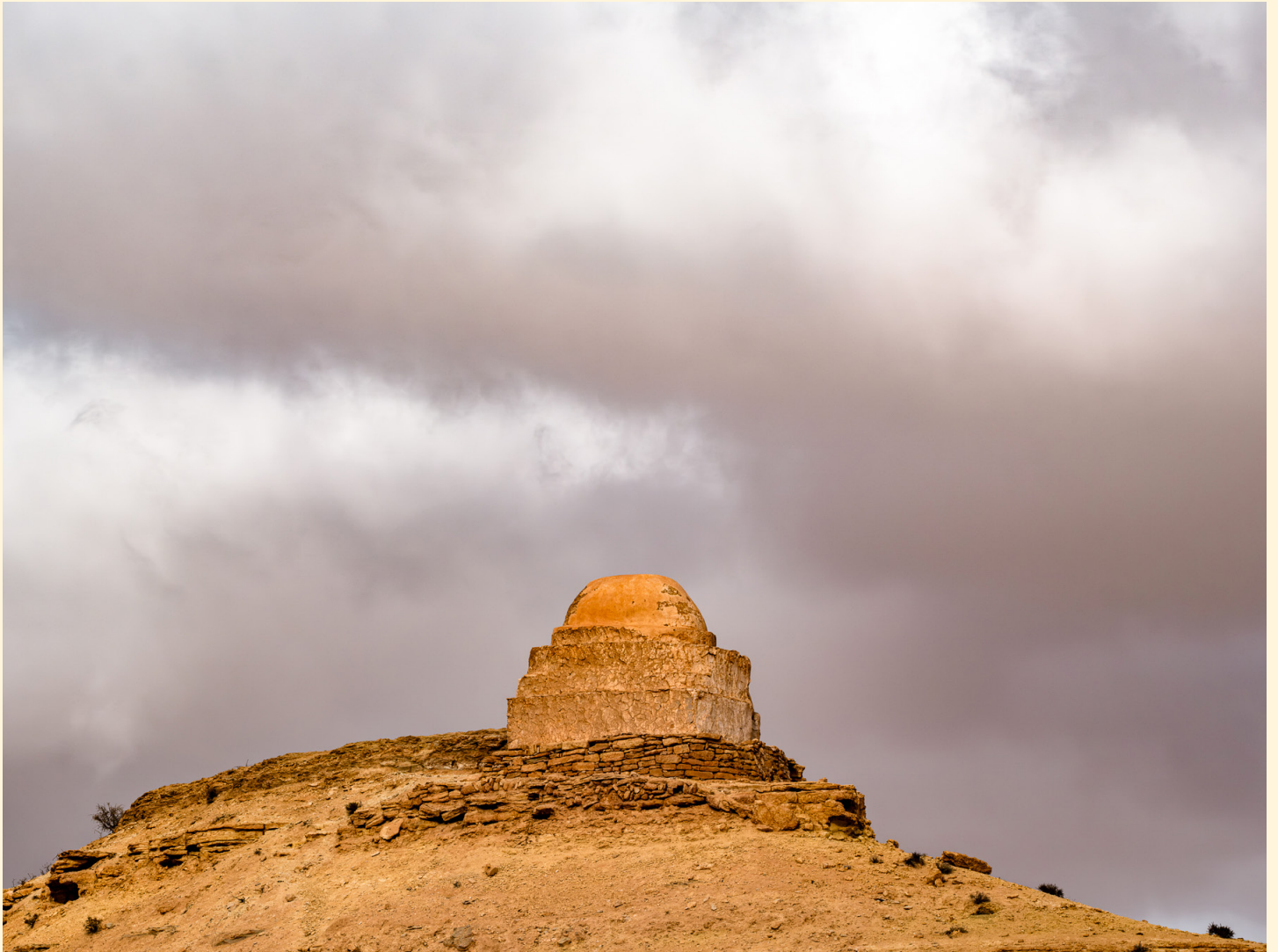
Marabout Chenini Tataouine 11/2023