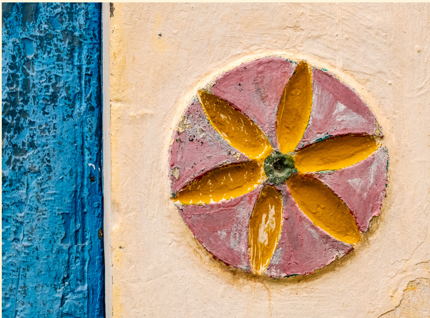
Symbale de roue solaire Ramla 03/2025