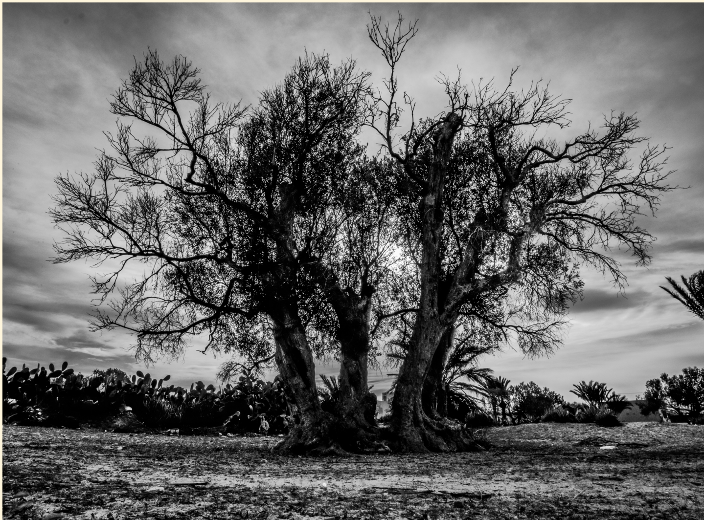
Sans doute le plus vieil olivier de l'archipel de Kerkennah Kellabine 01/2021