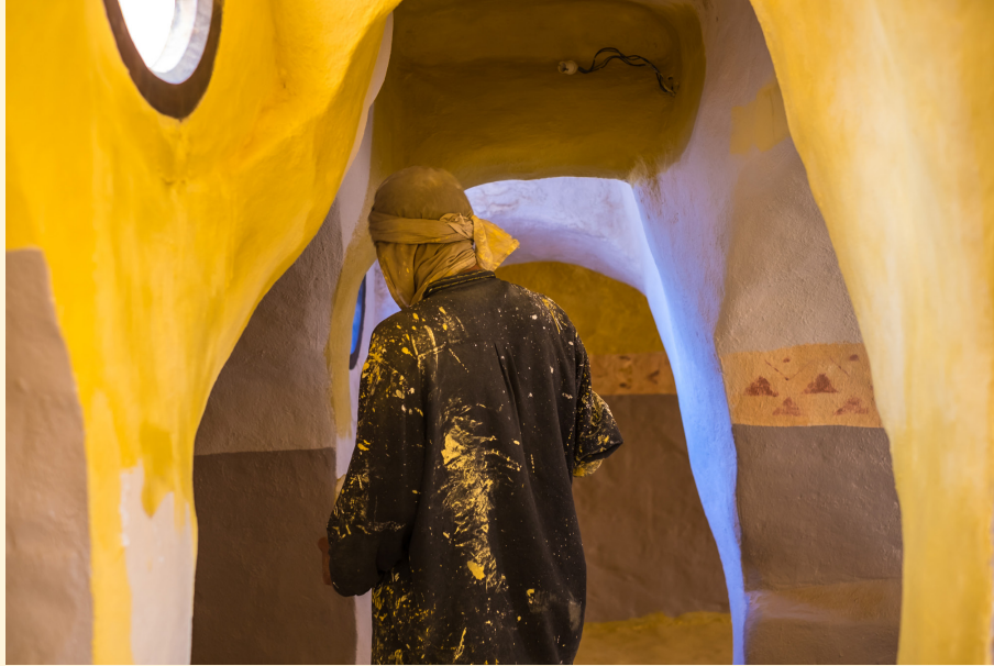
Ksar Haddada 04/2016

Une culture n'évolue pas seule, isolée, mais se nourrit d'un environnement plus large, de rencontres, d'échanges comme de traditions millénaires.