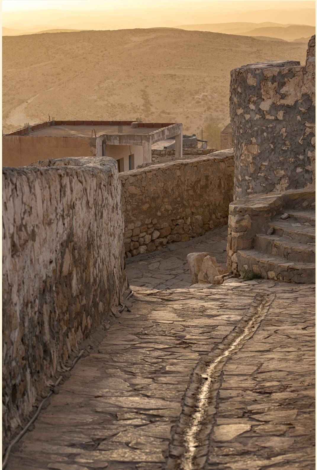
Village de Tamazret 11/2023