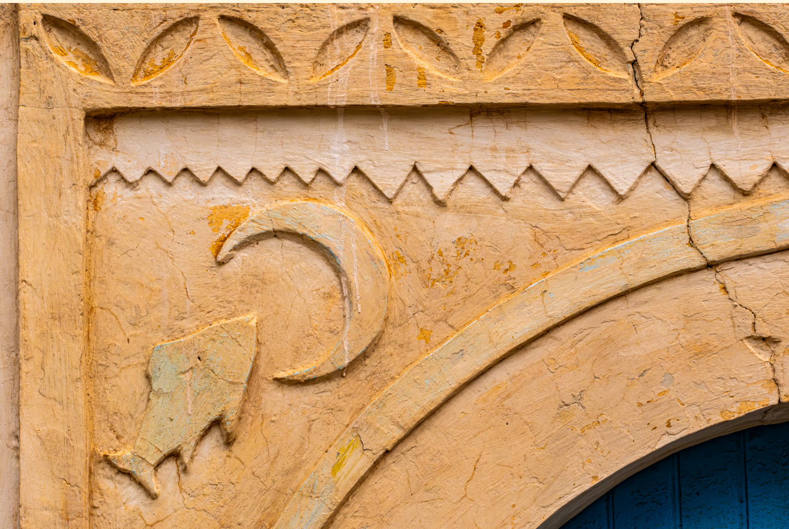
Symboles Ramla 03/25