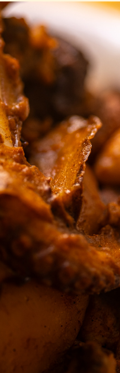
Couscous Ghala El Attaya 04/2025