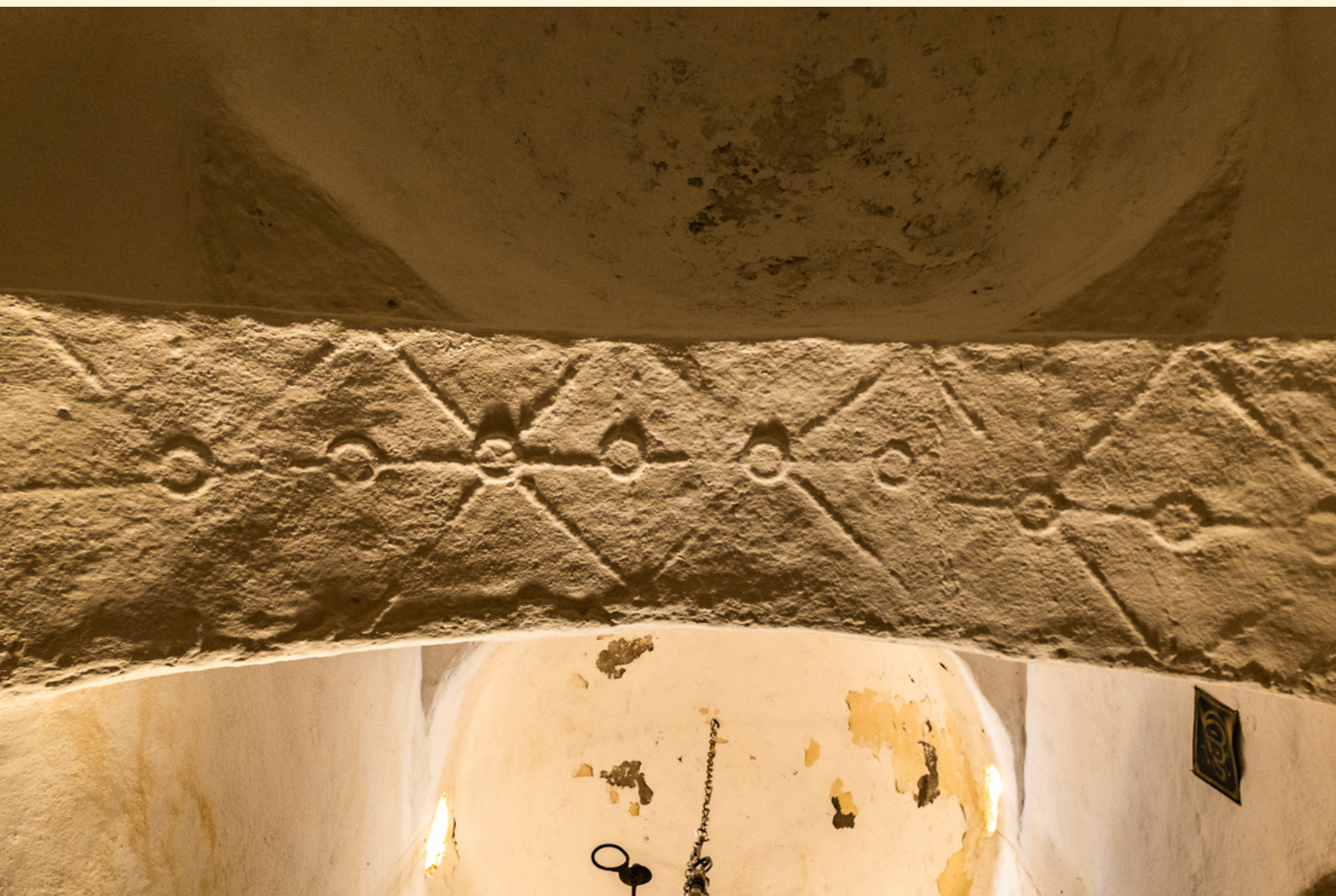
Voute de la mosquée des 7 Dormants Roue solaire dans son parcours est-ouest 11/2023