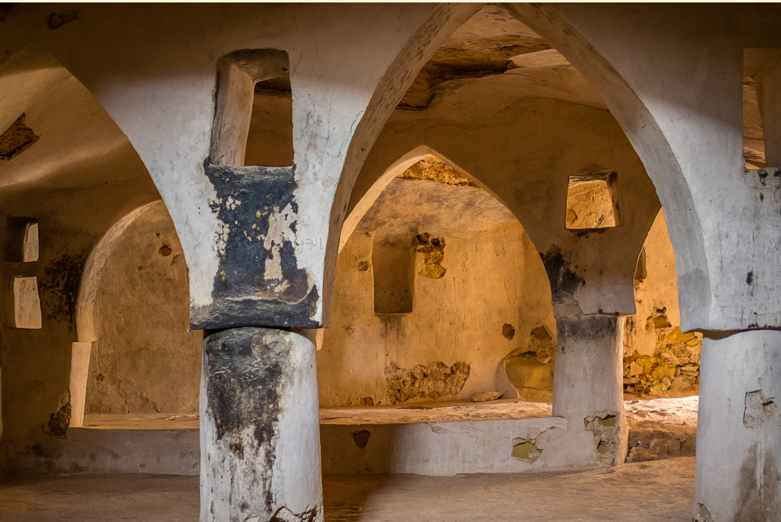
Lieu de culte troglodyte Zammour 03/2024