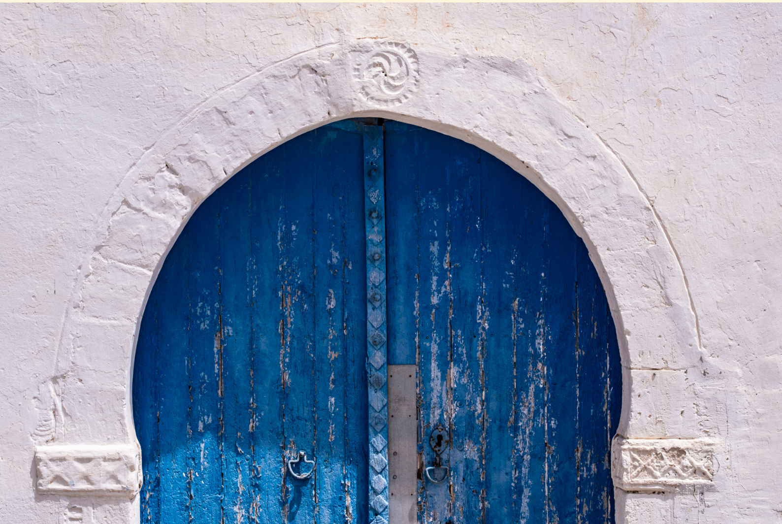
Symbole sur entrée Chergui 03/2025