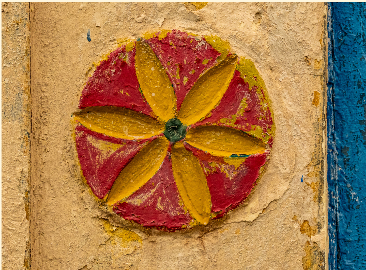
Symbole de roue solaire Ramla 03/2025