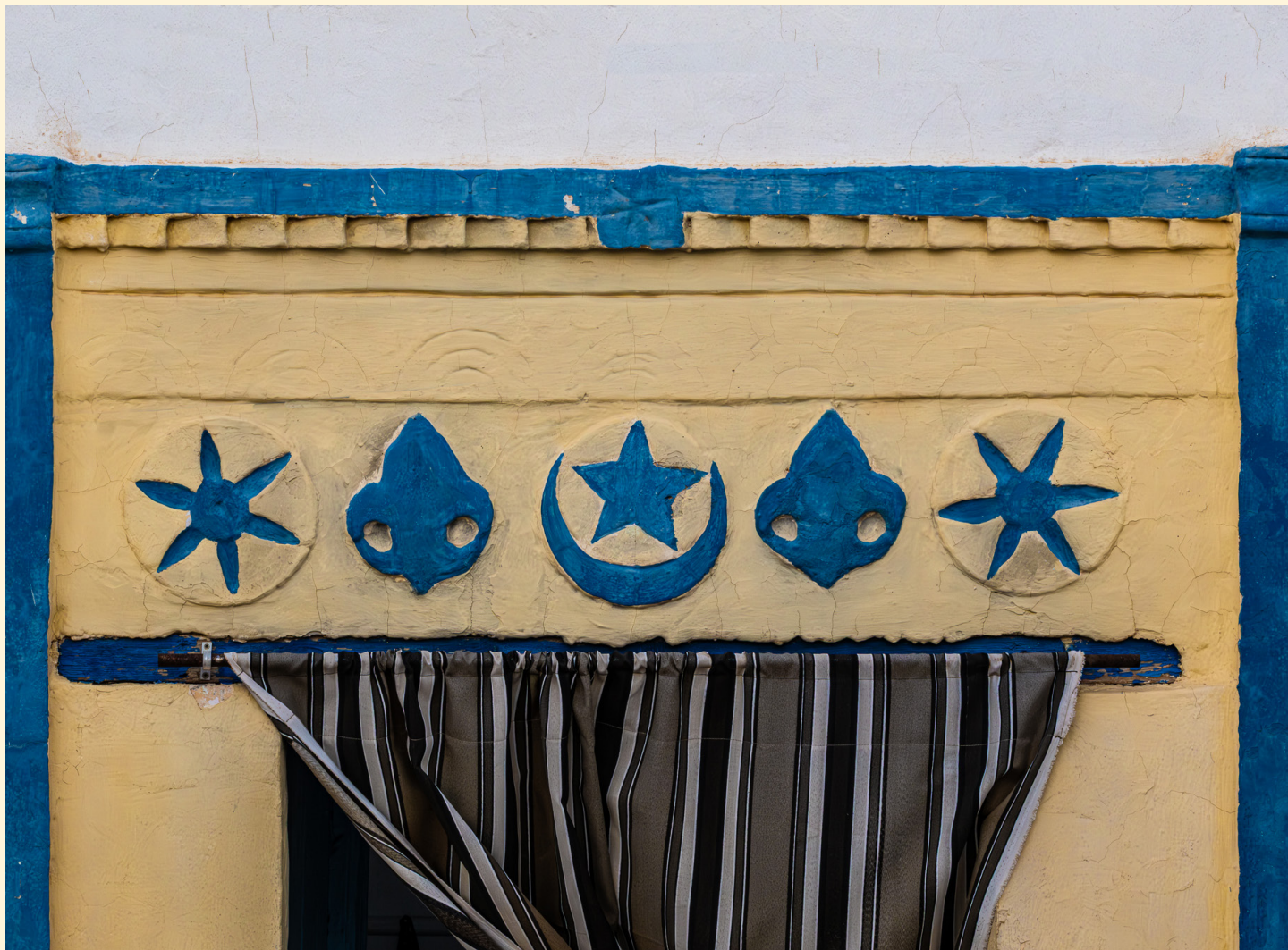
Symboles dans un patio Ramla 03/25