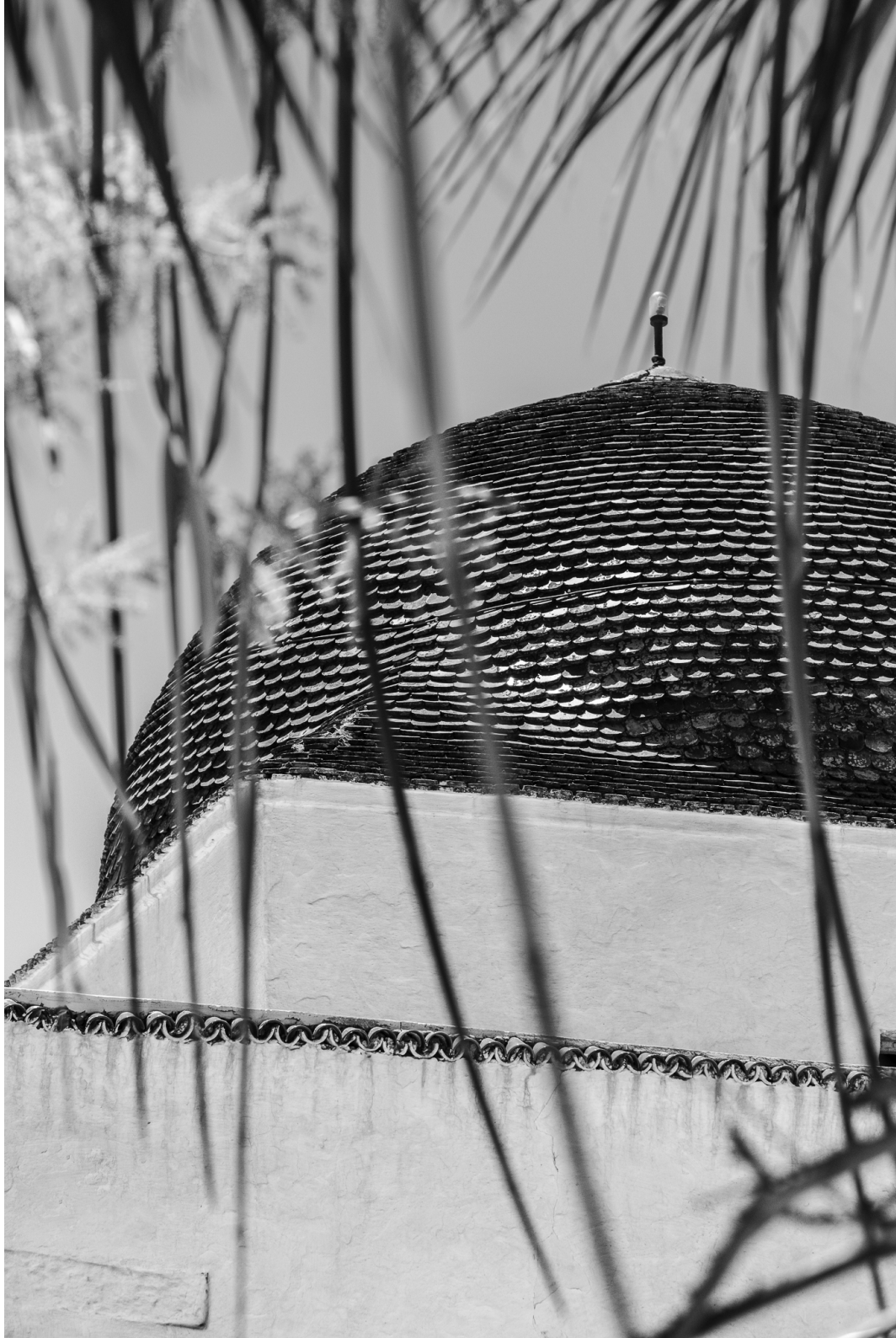
Houmt Souk 06/2025