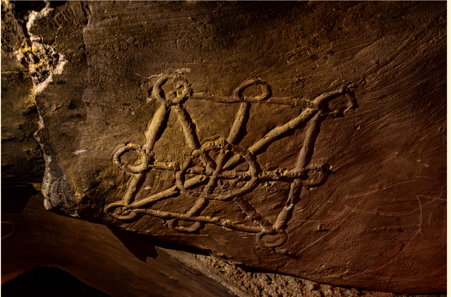
Sculpture Zammour 03/2024