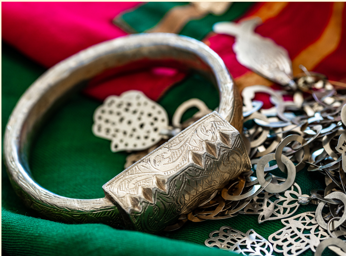
Bijoux traditionnels en argent El Attaya 04/2025