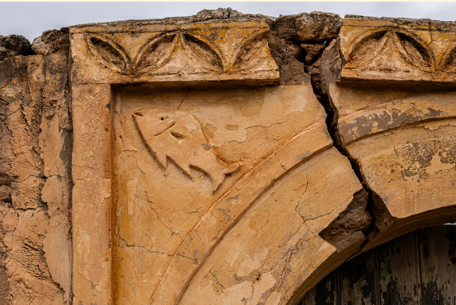
Porte Ramla 03/2025