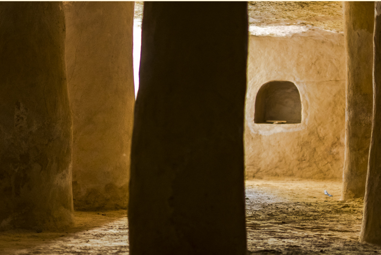
Mosquée souterraine Douiret 04/2016