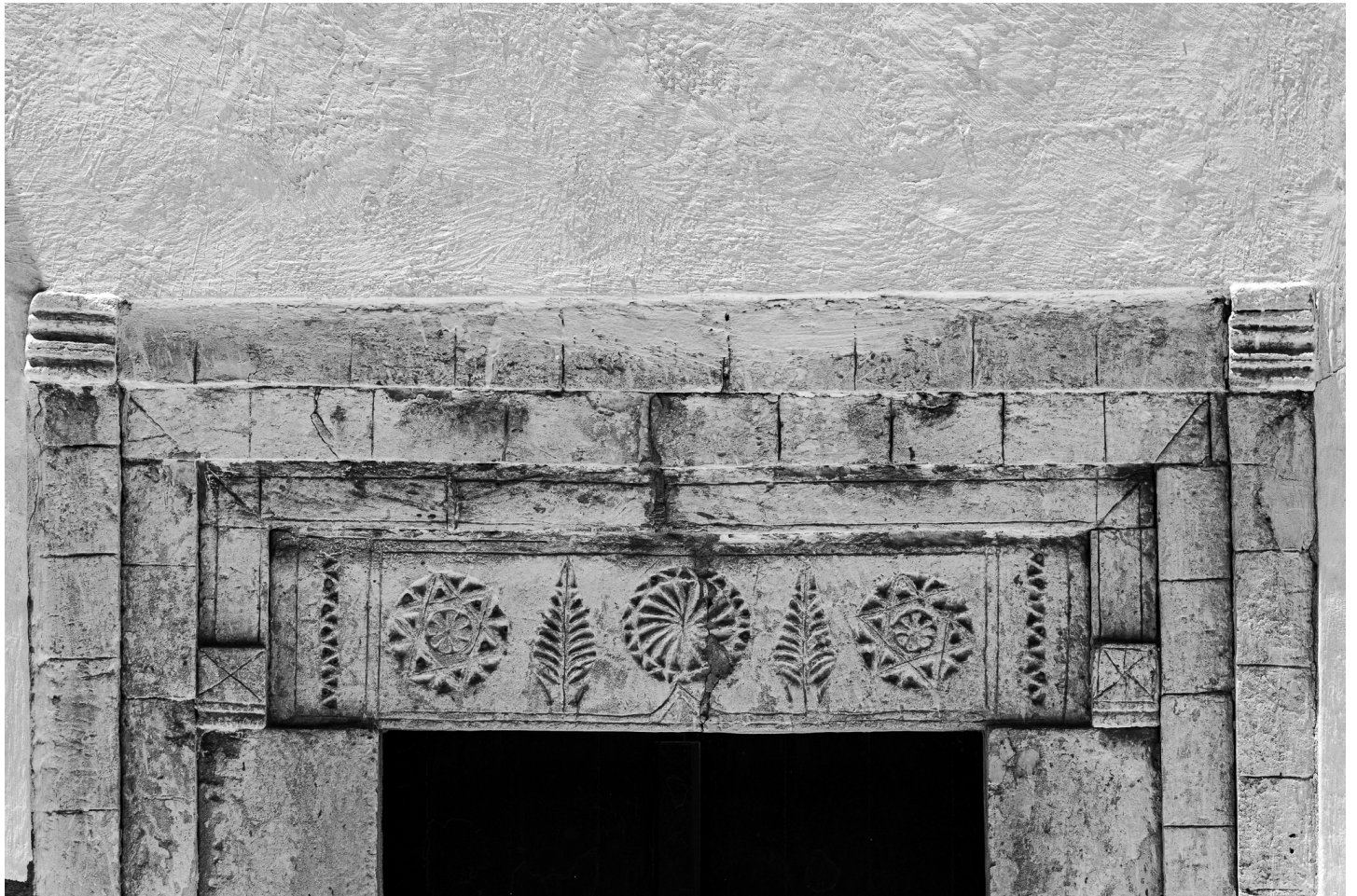
Houmt Souk 06/2025