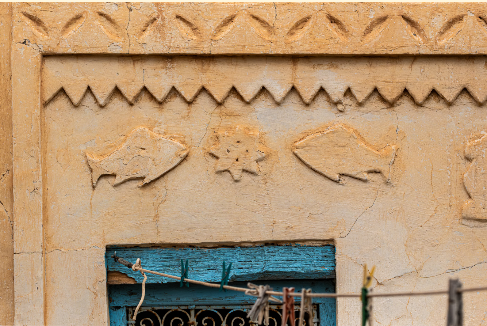
Symboles dans un patio Ramla 03/25