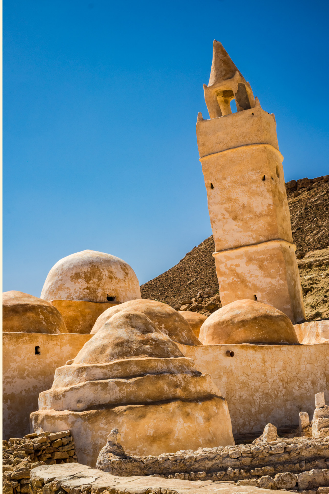
Mosquée des 7 dormants Chenini Tataouine 04/2016